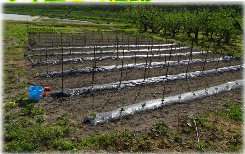
初の野菜栽培と農業