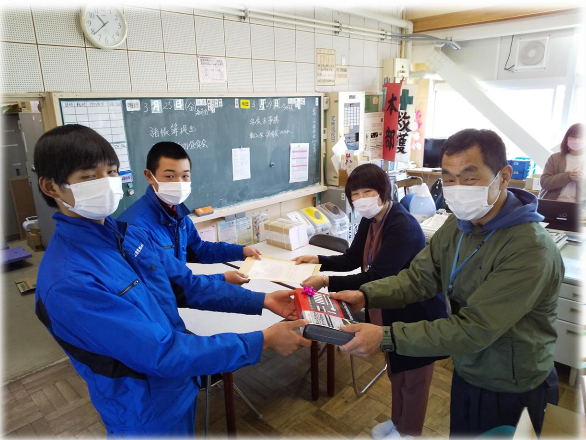
地元公共施設に寄付