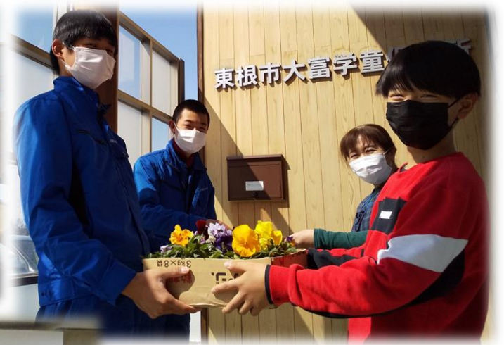
学童保育に花苗を寄付