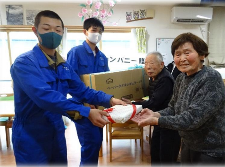
老人ホームに寄付(2か所)