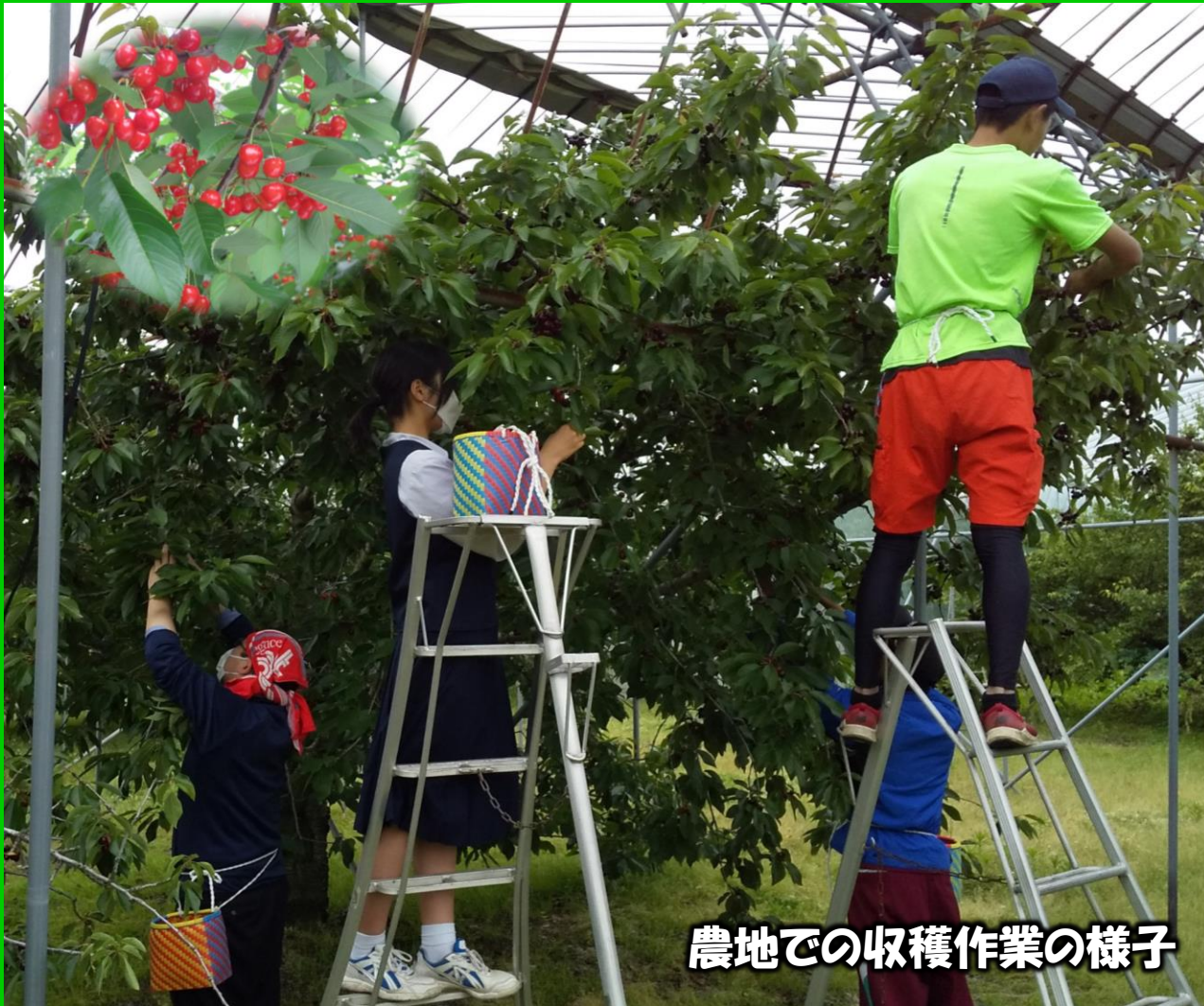
農地での収穫作業の様子

ねらい：農業に携わる高齢者のニーズに合わせ栽培ができない農家を助けたいとの思いから貢献の「質」にこだわり続け5月サクランボ畑を借用し栽培する。