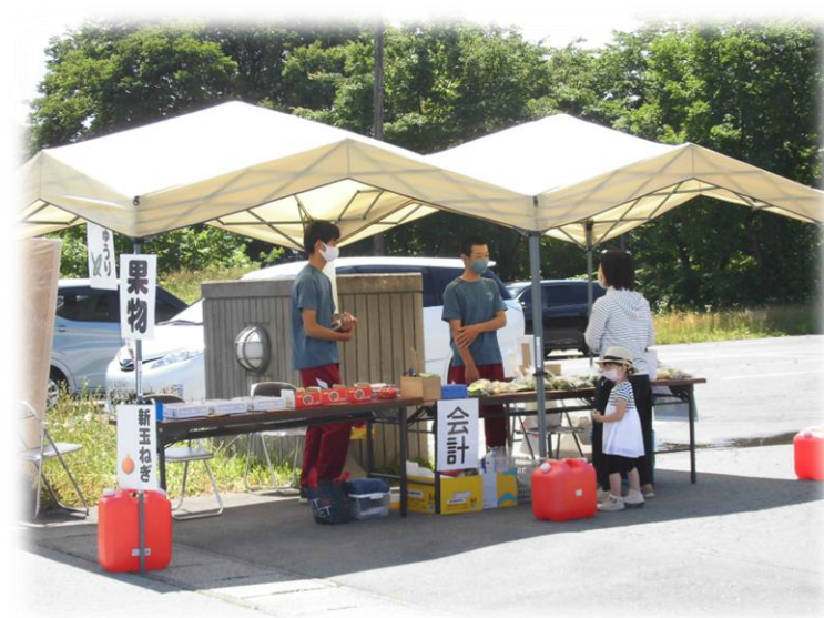
東郷地区移動販売 6月・9月