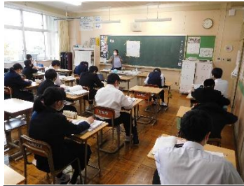
1年生数学平面上の座標軸