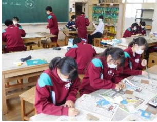
2年生美術オブジェ作り