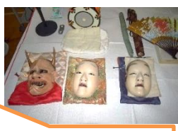
事前学習の様子です

9/12(火)13:20-15:00 に、文化庁「文化芸術による子供育成推進事業」として今年度本校にて「能・狂言教室」を開催させていただきます。一流の文化芸術を見てほしいと申し込んだところ、見事当選しました。本番を迎える前に事前学習の時間をつくっていただき、能についての知識を持って本番を迎えます。鑑賞を希望される方は、担当に電話願います。